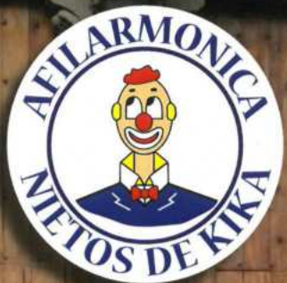
Carnaval 2016 - Gran Canaria - Afilarmonica Los Nietos de Kikas